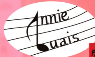
FÊTE DU JARDIN

MER. 27 18H30 GAGARPITAN Deuxième atelier du mois ! 20H00 CORALA REBELA Deuxième chorale du mois !