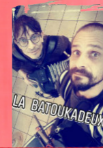
FÊTE DU JARDIN

A partir de 14h plein d'ateliers de jardinage, et de partages de savoirs animés par les bénévoles qui prennent soin chaque semaine de "la badouille". Cet espace vert face au café est cultivé depuis maintenant 4 ans. A 18h, en terrasse, ateliers danses folk non-générées, suivi de la Batukadeux par "les Dames Oiseaux": Disco, Musette, Punk, Tsigane, chansons à la carte... accordéon, grosse caisse, tout le monde debout sur les tables !