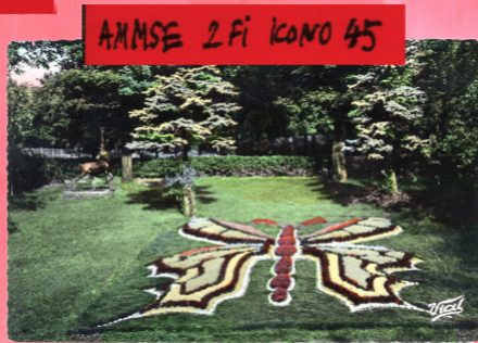
AMSE 2 Fi kono 45

VEN. 22 16H00 2ÈME FANZINE AUTOUR DE LA SANTÉ MENTALE